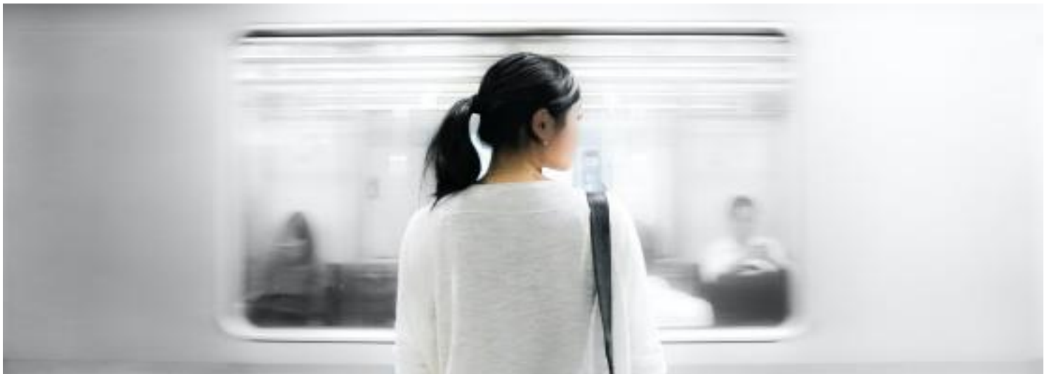
2. Våre risikoområder.

Prioriteringen av hvilke risikoområder som skal håndteres først, har blitt gjort på bakgrunn av avdekket risiko og omfang. Av de 17 leverandørene som har blitt undersøkt i detalj er 8 leverandører i kategori 1, dvs. at leverandørene har etablert gode rutiner for å sikre systemer og rutiner for menneskerettigheter og anstendig arbeidsforhold i sin verdikjede. 3 leverandører er i kategori 2, dvs. at leverandøren har igangsatt arbeidet med å forbedre sine rutiner og må følges opp. Vi har identifisert 6 leverandører hvor vi ikke finner informasjon om ansvarlighet og heller ikke får tilfredsstillende svar om hvilke rutiner som er etablert. Denne gruppen blir prioritert å følge opp i handlingsplanen for det kommende året.